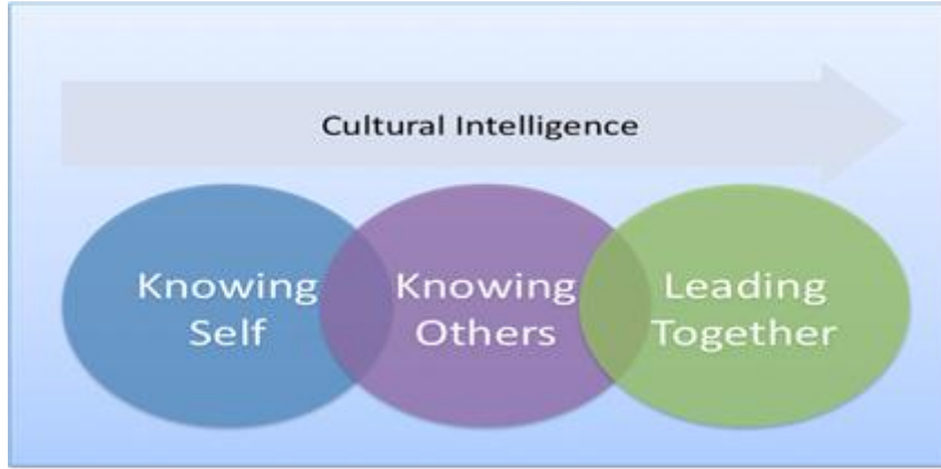
شكل (١) يوضح ماهية الذكاء الثقافي عن (www.meetunivvisitry.com)